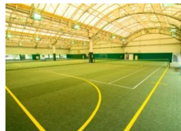
インドアテニスコート (人口芝コート 3面)

アウトドアコートは 足腰への負担軽減 した優しいオムニコート インドアコートは 人口芝となります