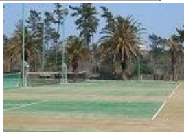
アウトドアテニスコート (オムニ 5面)

クロークの事前予約は行っておりません ※着替えなどは大浴場、トイレ、ガーデンプール更衣室をご利用ください お弁当などの持込不可(昼食はオプションにて承ります) テニスコートは8名様毎に1面がプラン適用となります お食事はレストランにてご提供いたします 10名様以上でご利用の場合、ご夕食は宴会場のご利用が可能です(要予約)